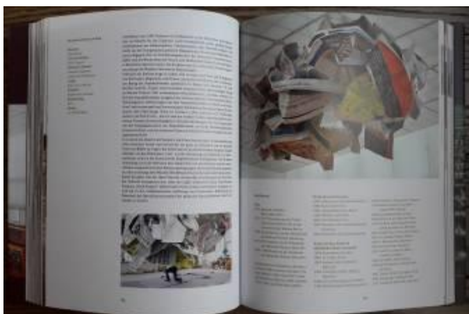
Ukážka spracovania jednotlivých diel v 270 str. publikácii Kunst um Bau / Projekte des Bundes , dokumentujúcej obdobie 2006 - 2013